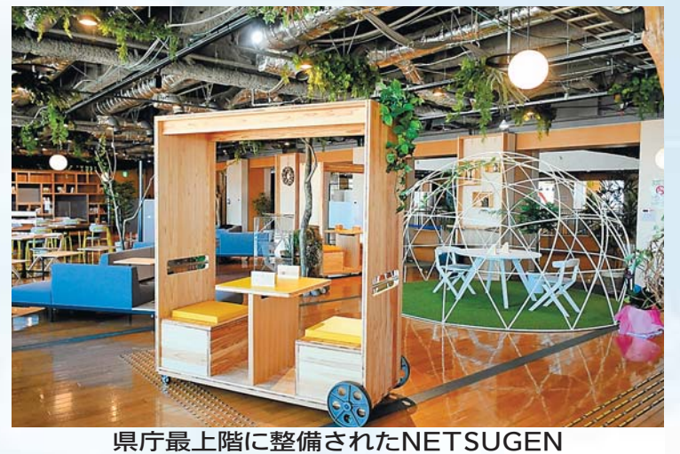
県庁最上階に整備されたNETSUGEN