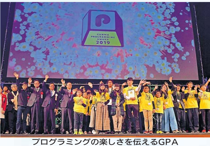
プログラミングの楽しさを伝えるGPA

の時代は企業も行政も壁を取り払うことが大事になる。そういう意味で、研究と開発も、教育と同じように壁を取り払って世界に発信できるようにものをつくりたい。金井 群馬県をICTの聖地にするという取り組みをずっとやってきた。特に今、前橋市がス