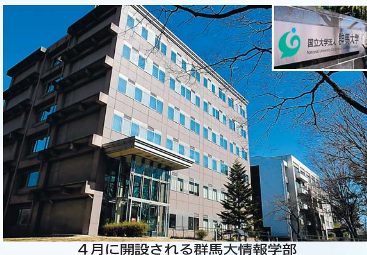
4月に開設される群馬大情報学部