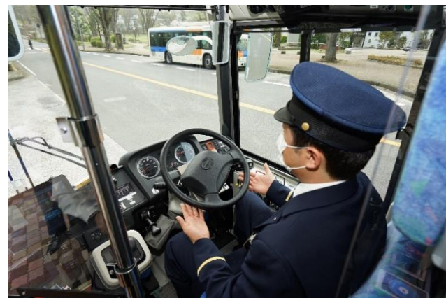
左近山団地での自動運転の様子